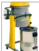
Cuve collecteur facile à vidanger