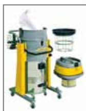
Système de filtration double (microfiltre + filtre coton)