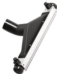
6511365 RACLEUR-EAU REGLABLE 50CM DIA 50MM