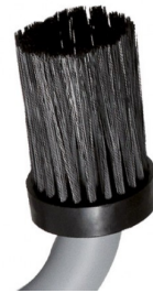
2511612 BROSSE RONDE POUR BUSE COUDE DIA 50MM