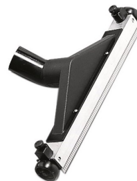
6511370 RACLEUR-EAU REGLABLE 60CM DIA 50MM