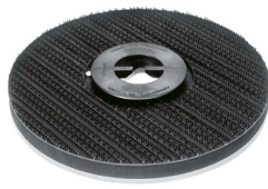
40.1008.00 Porte pad 355mm (pour 15" pad)