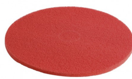
C15-RE PAD NYLON ROUGE DIA 380 MM (par 6)