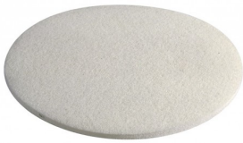
C15-WH PAD NYLON BLANC DIA 380 MM (par 6)