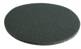
C15-GR PAD NYLON VERT DIA 380 MM (par 6)