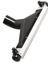
6511370 REGELBARE WATERAFTREKKER 60CM DIA 50MM