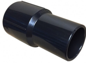
6511135 SLANGKOPPELING DIA 40MM (KANT TOEBEHOR)