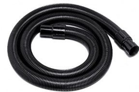
6511205 ZUIGSLANG COMPLEET 2,5M - DIA. 40MM