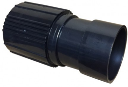
6511115 KETELKOPPELING DIA 40MM (KANT KETEL)