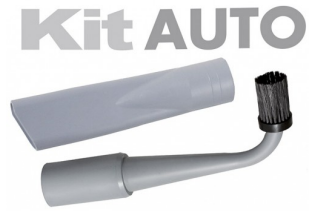
6170045 KIT AUTO