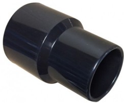
6511315 SLANGKOPPELING DIA 50MM