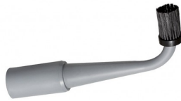
2511613 GEBOGEN ZUIGBEK IN RUBBER (anti-kras) dia 50mm