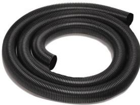
650082010 10M ZUIGSLANG DIA 40MM (40X48MM)