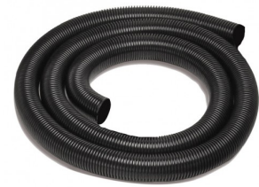
65008207 7M ZUIGSLANG DIA 40MM (40X48MM)