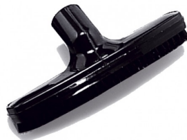
6511045 OVALE BORSTEL DIA 36MM-40MM