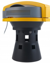
6512660 VLOTTERSYSTEEM COMPLEET (35/56L)