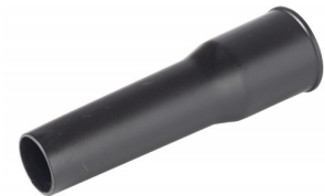
6511155 CONISCH-REDUCTIE DIA 40MM (35 TOT 38MM)