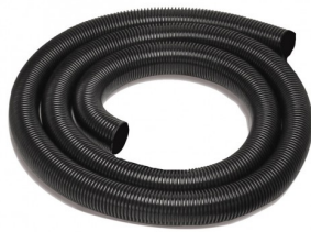
65008203 3M ZUIGSLANG DIA 40MM (40X48MM)