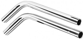
6511140 INOX VERLENGBUIS (PER 2) - DIA. 40MM