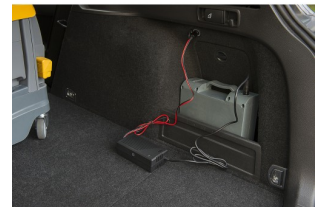
18.0065.00 AUTOLADER 24-12V 5A