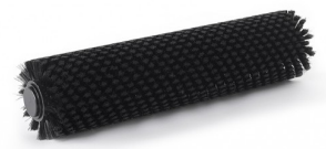
40.5000.03 CYLINDRISCHE BORSTEL IN TYNEX (zwart)