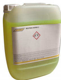
6500010 REINIGINGSZEEP 10L (GEUREND)