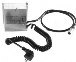
22.0619.00 BATTERIJLADER 24 V 5A