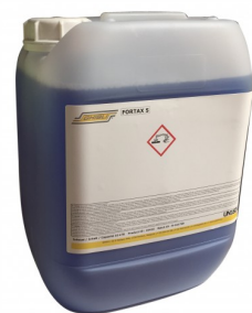
6500020 REINIGINGSZEEP 10L (ONTVETTEND)