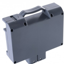
22.0508.01 BATTERIJPACK Li Fe P04 24V 20 AH