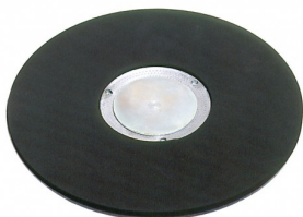
00-253 Schuurpapierhouder dia 405mm