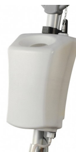
00-330 Detergent tank 12L