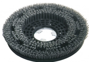
00-246 Tynex schrobborstel dia 430mm