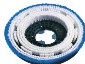
00-243 Tapijtborstel dia 430mm