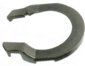
14-110 EXTRA GEWICHT 10 KG DIA 430 MM