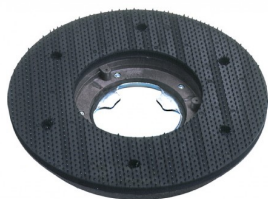
00-240 Padhouder dia 430mm voor 154-227 rpm