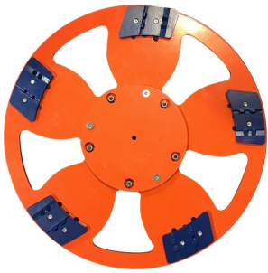
00-304 DRONE 5 DISK SCRAPER