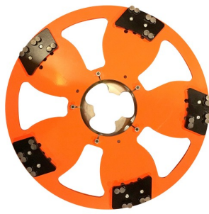
DRONE 5 DISK BLACK DIAMOND