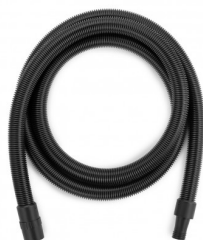
6010536 FLEXIBELE SLANG dia. 38 - 4 M